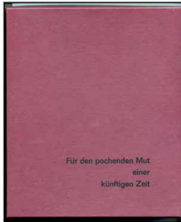
Kassette: 20 cm *24 cm * 3 cm

Kosten: 100 € bis zum 28.5.2004, danach 150 €. Bestellung an Kontaktadresse.